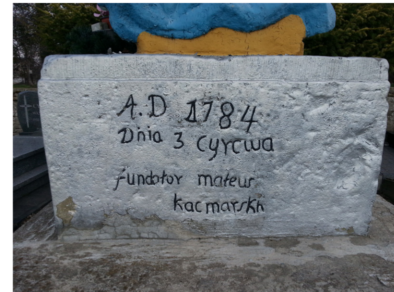
Napis na postumencie figury Matki Boskiej Bolesnej