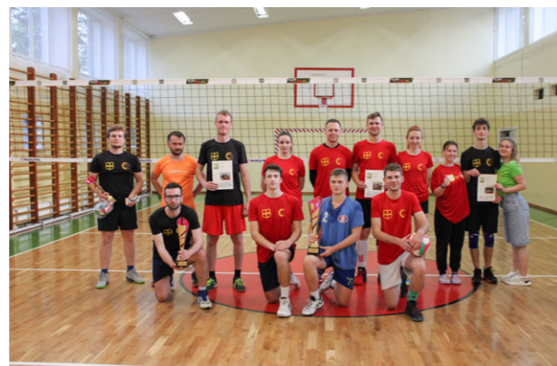
Uczestnicy meczu pokazowego Lacosanostra – Reszta Świata