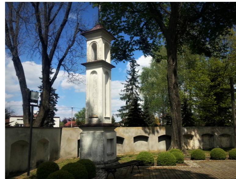
Kapliczka na terenie cmentarza przykościelnego w Kurowie

Okres oświecenia przyniósł nowe spojrzenie na opisywaną problematykę. W czasie ostatnich lat I Rzeczypospolitej, na mocy Uniwersału dla Miast Wolnych wydanego w 1792 r. władze zabroniły chowania ludzi na cmentarzach przykościelnych i pod posadzkami świątyni. Zamiast uświęconych tradycją miejsc pochówków, nakazano zakładanie nowych nekropolii wyznaczonych z dala od siedzib ludzkich. Za wspomnianą regulacją przemawiały kwestie higieniczno-sanitarne i przepelnienie cmentarzy. Wprowadzanie powyższych regulacji wiązało się z ogromnym oporem społeczeństwa sprzeciwiającego się grzebaniu jak określano „w polu”. Biskup lubelski i chełmski w 1792 roku wydał zgodę na założenie nowego cmentarza w Lublinie. Pierwsze groby, które założono na cmentarzu przy Lipowej datowane są dopiero na jesień 1811 r. Do jednego z najstarszych nieprzykościelnych cmentarzy w kraju należy cmentarz we Włostowicach założony w 1801 r. (choć najwcześniejszy zachowany nagrobek pochodzi z 1797 r., czyli pochówki w tym miejscu odbywały się jeszcze przed oficjalnym powstaniem cmentarza, m.in. pochówki innowiercze). Nie zawsze potrafiono uszanować poświęconą ziemię, o czym może świadczyć przykład wspomnianych Włostowic.