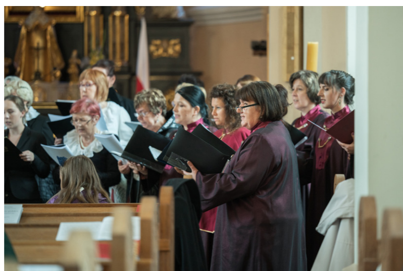
XII Dni Muzyki, wrzesień 2022 r. Kościół św. Klemensa i św. Małgorzaty w Klementowicach