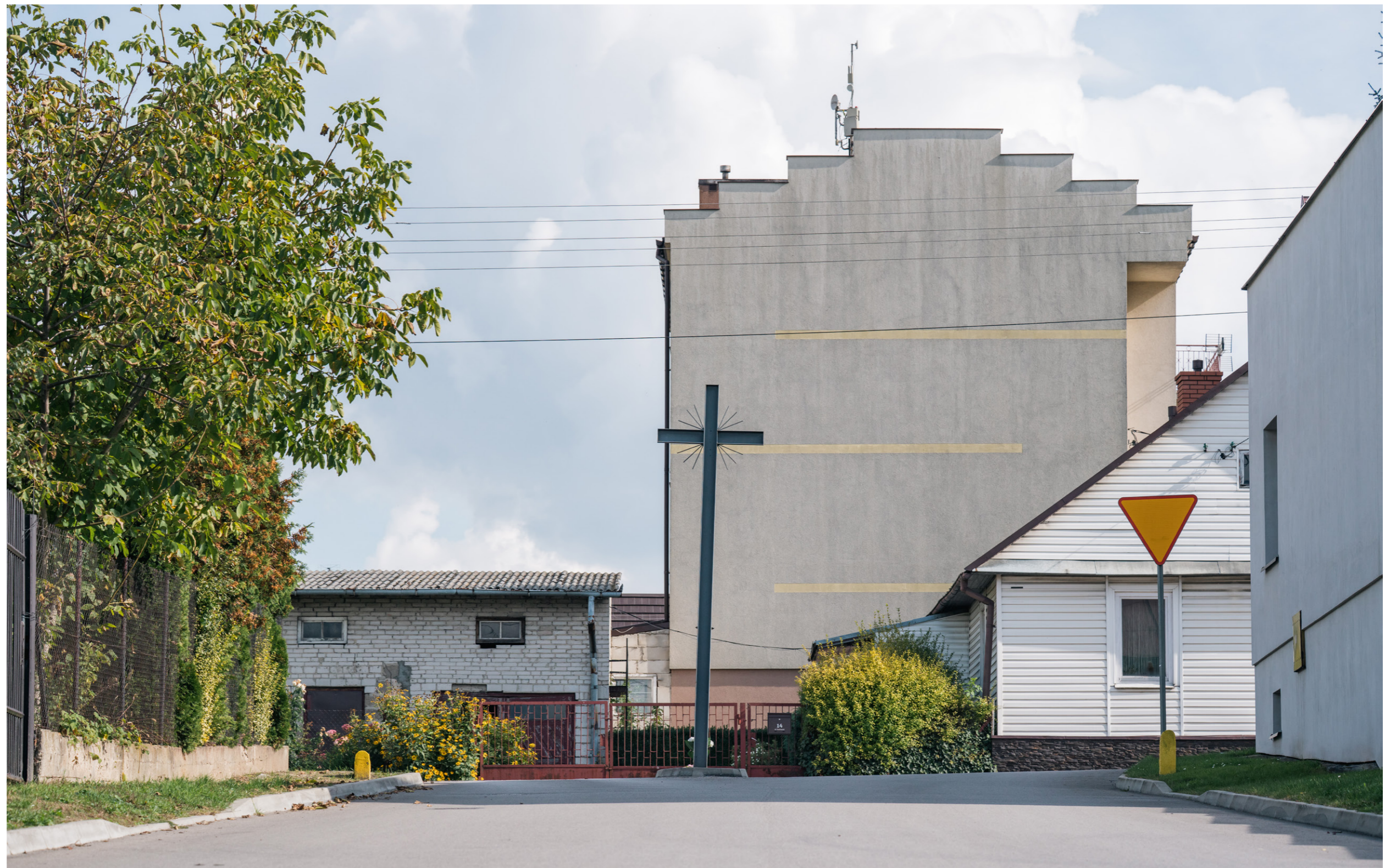
Ulica Kościuszki, widok z ulicy Kowalskiej, 2022 rok.