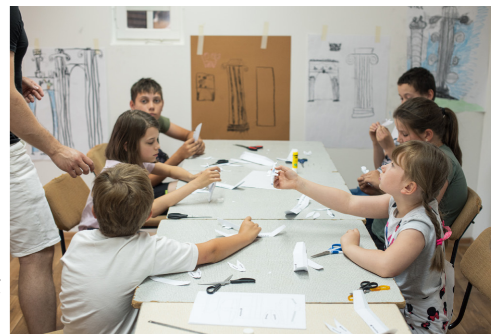
Warsztaty budowy latających modeli, lipiec 2022 r. Gminny Ośrodek Kultury w Kurowie