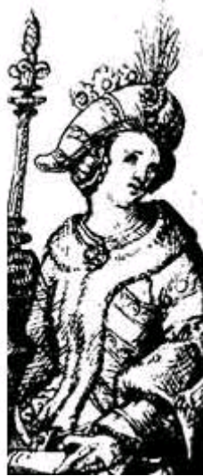
Zofia Holszańska /1405 – 1461/ Królowa Polski /1424-1461/