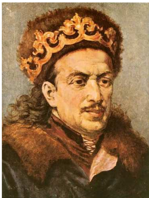
Kazimierz Jagiellończyk /1427 – 1492/ król Polski /1445 – 1492/