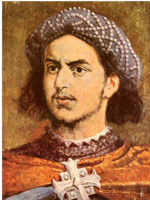
Władysław Warneńczyk /1424 – 1444/ Król Polski /1434 – 1444/

Wysoka pozycja jaką miał na dworze króla Władysława Warneńczyka sprawiła, że w 1440 r. objął urząd kasztelana sądeckiego a następnie sędziego generalnego ziemi sądeckiej.