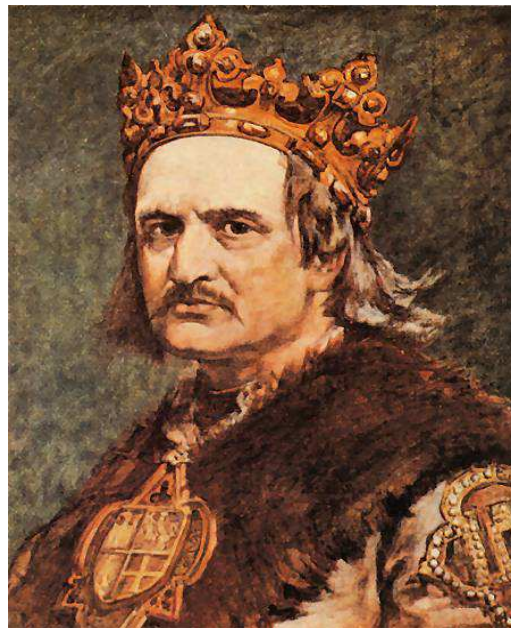
Władysław Jagiełło/ 1348 – 1434/ Król Polski/ 1386 – 1434/