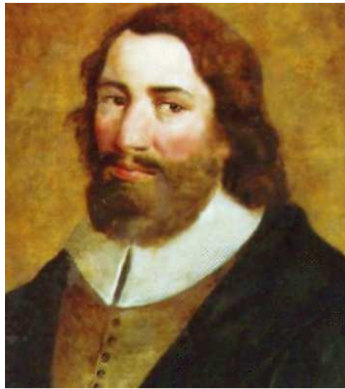
Mikołaj Kurowski arcybiskup gnieźnieński