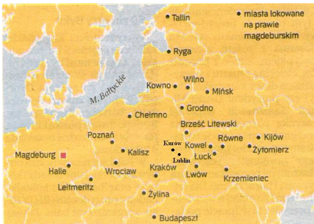
Miasta lokowane na prawie magdeburskim.

W Polsce prawo magdeburskie określające ustrój miast funkcjonowało do uchwalenia Konstytucji 3 Maja 1791 r. Natomiast na Ukrainie obowiązywało w tym zakresie do 1842 r.