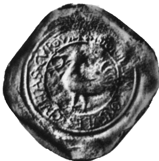
„Sygillum Consules Civitas Kurum – 1557”

Najstarsza pieczęć miejska pochodząca z 1557 r. znajduje się w Muzeum Czapskich w Krakowie. Widoczny jest na niej wizerunek Kura z Nałęczem w dziobie z napisem